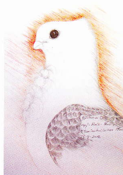
Kopfstudie eines rasstypischen Altorientalischen Mövchens von Dieter M. Fliedner, D.

Allen bekannten Züchtern der Rasse wurden bereits Ende September entsprechende Unterlagen zugesandt, wobei der genaue Zeitpunkt und die Räumlichkeit der Gründungsversammlung noch nicht feststehen. Genaueres wird rechtzeitig in der Deutschen Fachpresse